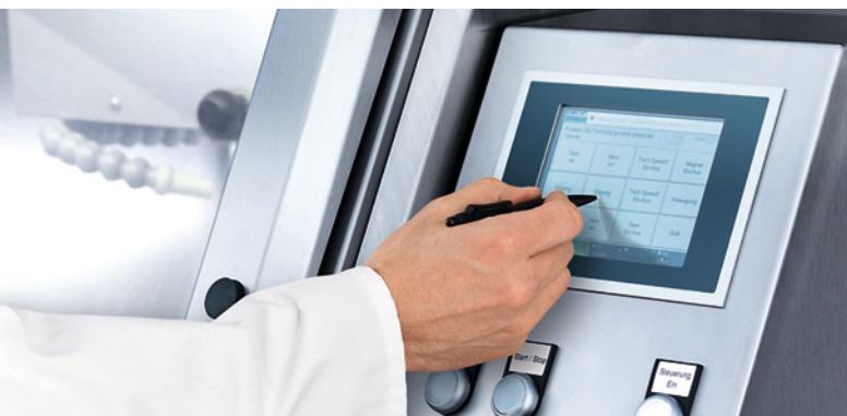
Удобный сенсорный экран