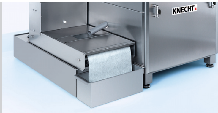
Устройство охлаждающей жидкости с ленточным фильтром