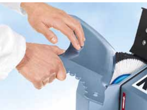
Полирование куттерных ножей на пластинчатой щетке