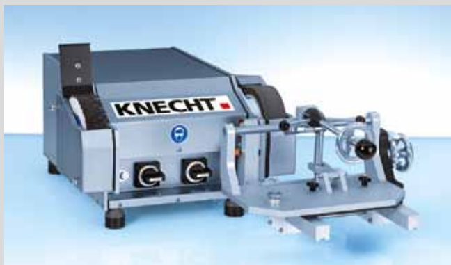
Модель с ленточным устройством S 200 BT