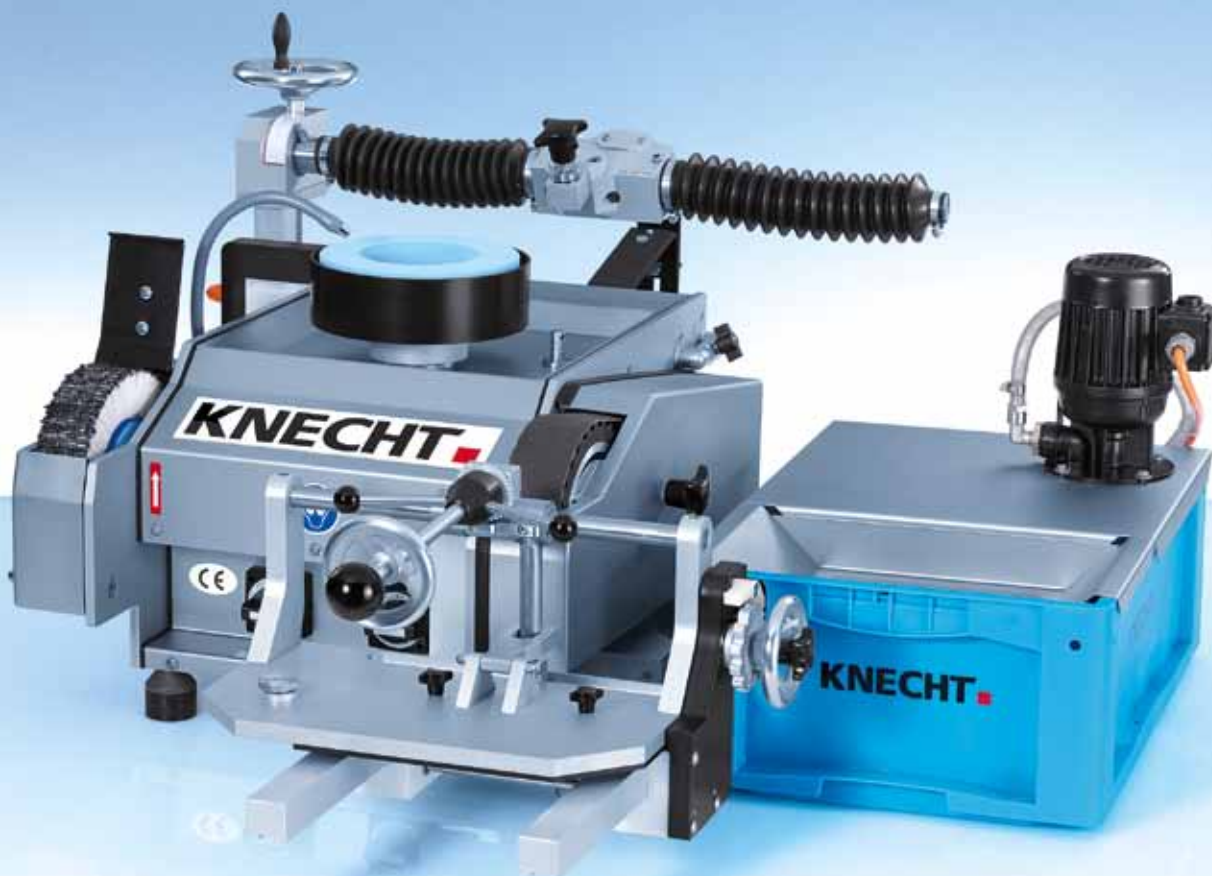
Настольная модель S 200 T и отдельно стоящее устройство для подачи охлаждающей жидкости EP 205