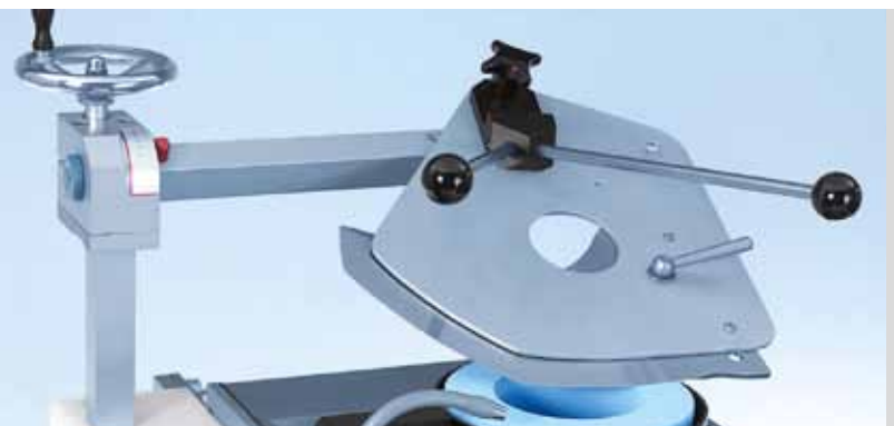
Стандартный шлифовальный рукав для серповидных куттерных ножей