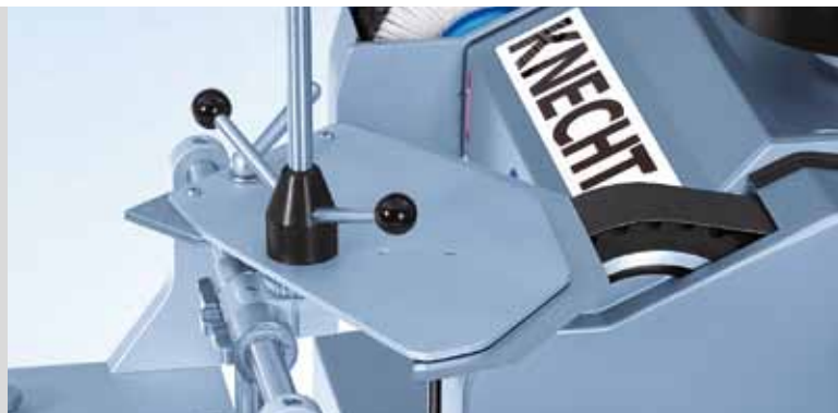
Универсальное ленточное шлифовальное устройство HV 262 для линейных и серповидных куттерных ножей

Постоянное высокое качество колбас и абсолютная надежность производства неизменно обеспечиваются прецизионной заточкой режущего инструмента и совершенной геометрией лезвий куттерных ножей.