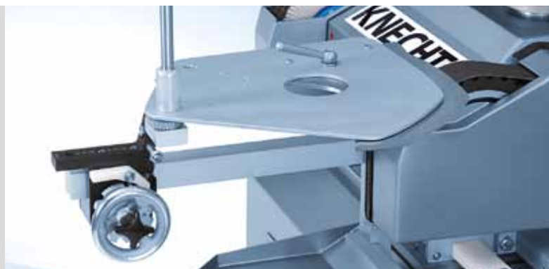
Ленточное шлифовальное устройство HV 261 для серповидных куттерных ножей