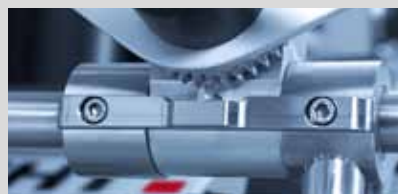
Защита от перекручивания при смене ножей