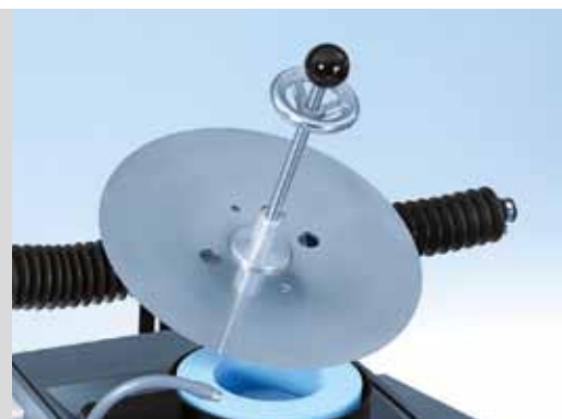
Дисковый нож Ø 80 -Ø 480 мм на чашечный шлифовальный круг