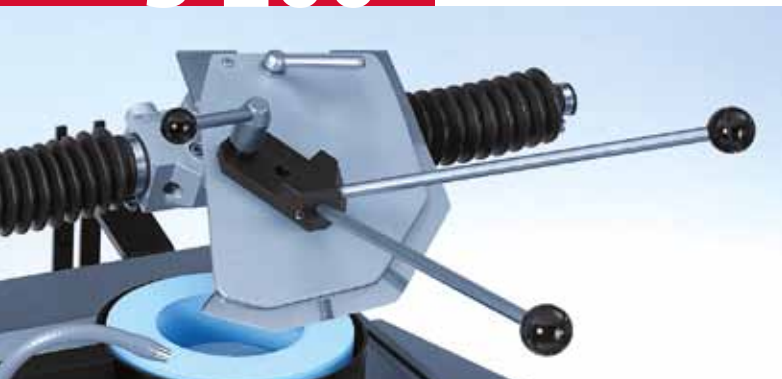
Универсальный шлифовочный рукав HV 203 для линейных и серповидных куттерных ножей