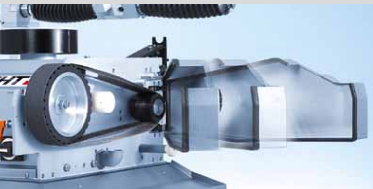
Замена шлифовальной ленты