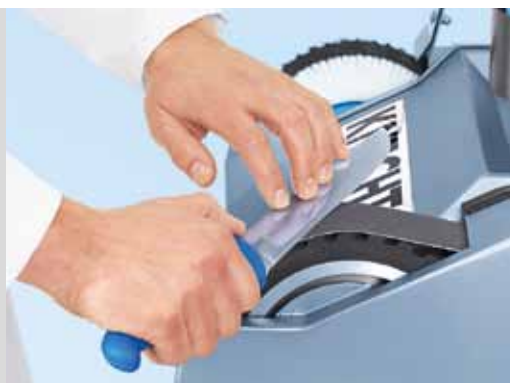
Шлифовка ручных ножей на шлифовальной ленте с охлаждением